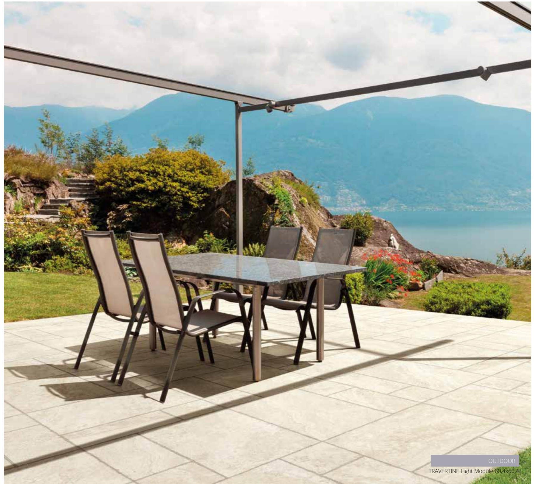
OUTDOOR TRAVERTINE Light Module 60,4x60,4