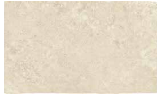
30x50 TRAVERTINE LIGHT 8011634607727