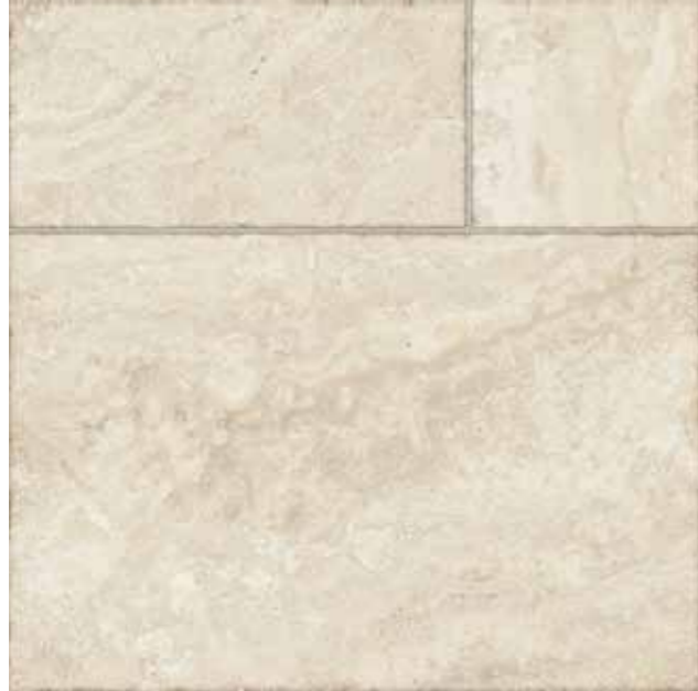
60,4x60,4 TRAVERTINE LIGHT MODULE GRIP 8011634607765