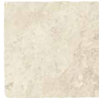
30x30 TRAVERTINE LIGHT 8011634607734