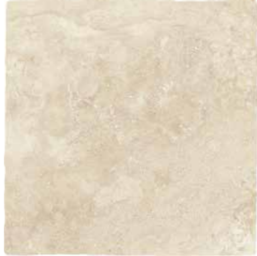
50x50 TRAVERTINE LIGHT 8011634607710