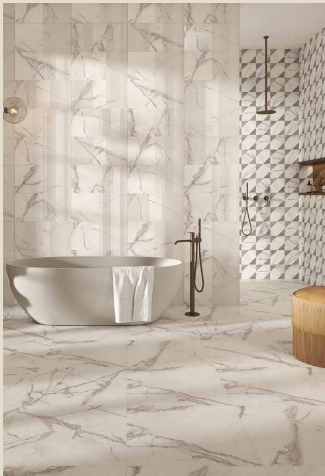
IBERIS CRYSTAL 60X60 RET IBERIS CRYSTAL 3D 30X60 RET IBERIS 20X20 MIX DEC