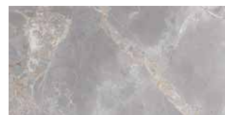
30x60 Ret IBERIS ELITE 8011634629835