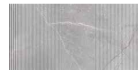
30x60 Ret IBERIS ELITE 3D 8011634629897

GREENWOOD LEGNO PAG. 132 GREENWOOD WOOD PAG. 132