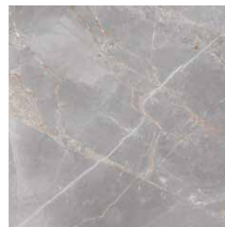
60x60 Ret IBERIS ELITE 8011634629811

Gres porcellanato smaltato digitale | glazed porcelain tile digital | grès cérame émaillé digital | glasiertes Feinsteinzeug digital