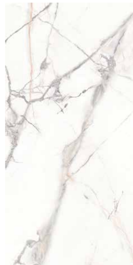
60x119,8 Ret IBERIS CRYSTAL 8011634645699

Gres porcellanato smaltato digitale | glazed porcelain tile digital | grès cérame émaillé digital | glasiertes Feinsteinzeug digital