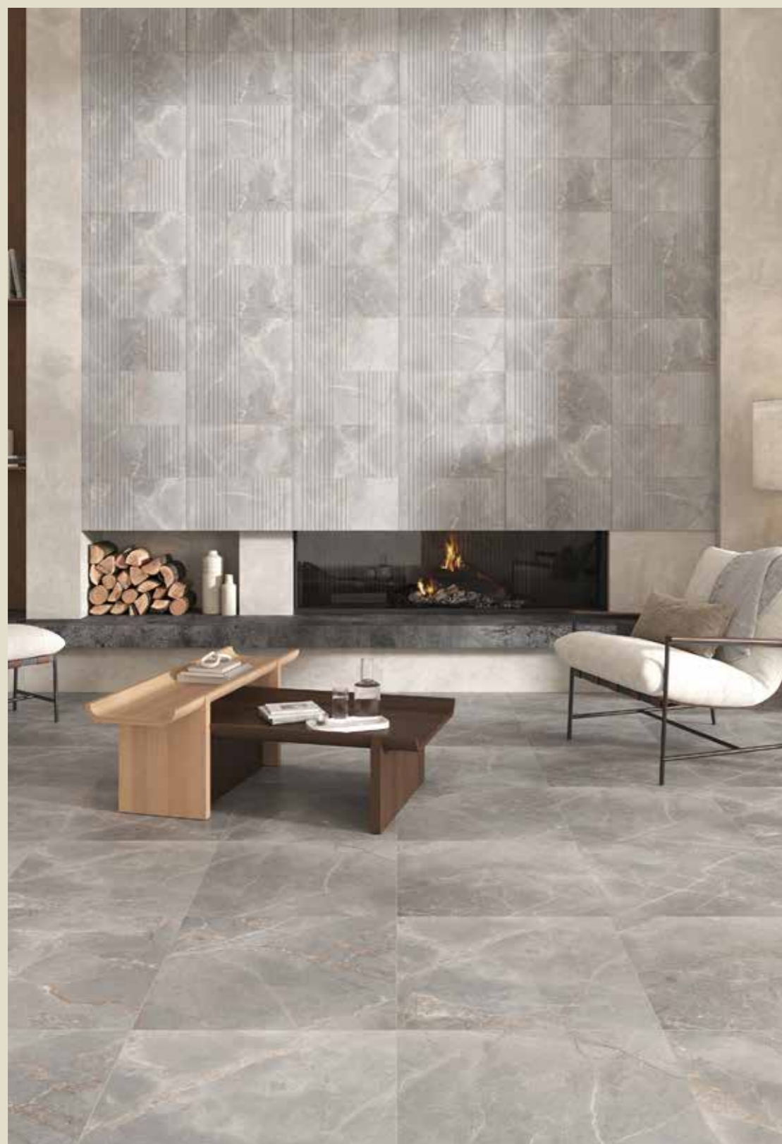
IBERIS ELITE 60X60 RET IBERIS ELITE 3D 30X60 RET