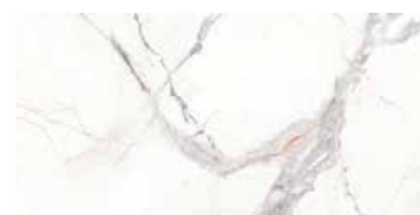
30x60 Ret IBERIS CRYSTAL 8011634629842