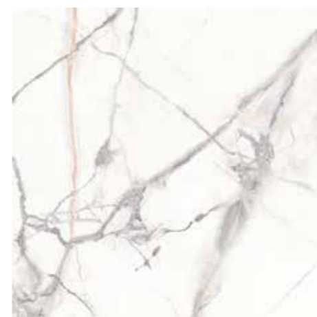
60x60 Ret IBERIS CRYSTAL 8011634629828

Gres porcellanato smaltato digitale | glazed porcelain tile digital | grès cérame émaillé digital | glasiertes Feinsteinzeug digital