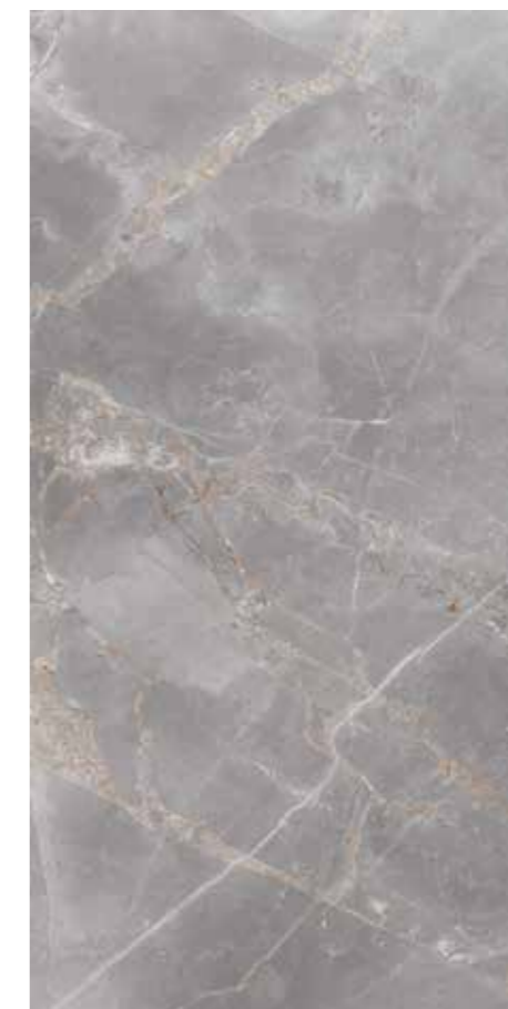
60x119,8 Ret IBERIS ELITE 8011634645705

GREENWOOD LEGNO PAG. 132 GREENWOOD WOOD PAG. 132