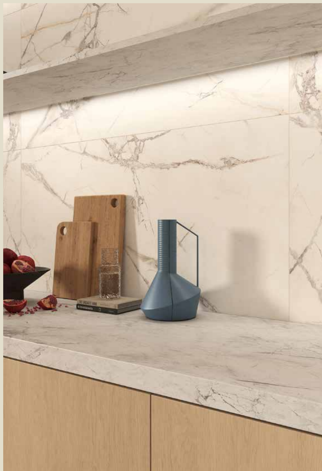
IBERIS CRYSTAL 60X119,8 RET